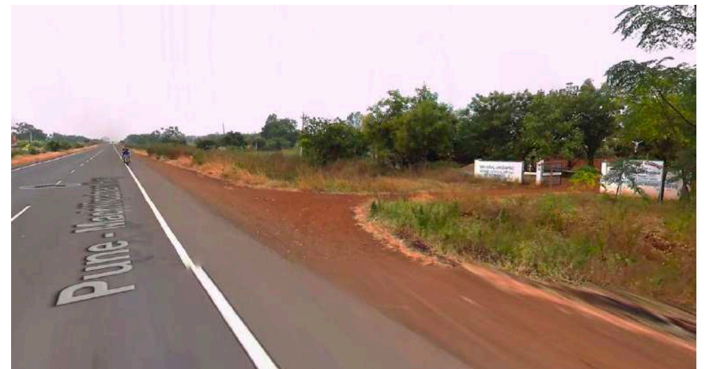
Dirección “Talmadgi”. A poco más de 2 km de esta pequeña localidad del distrito de Bidar, junto a una autopista de 850 km que conecta el este y el oeste de la India, se encuentra la Iglesia Católica de San Lorenzo, como un pequeño corazón que late por una comunidad cristiana de unas 170 familias, distribuidas en ocho aldeas.

Inspirada por el espíritu misionero de San Miguel Garicoïts y por la convicción de que “los betharramitas se atreven a ir donde nadie va” , la Con-